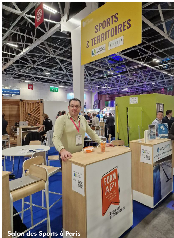
Salon des Sports à Paris