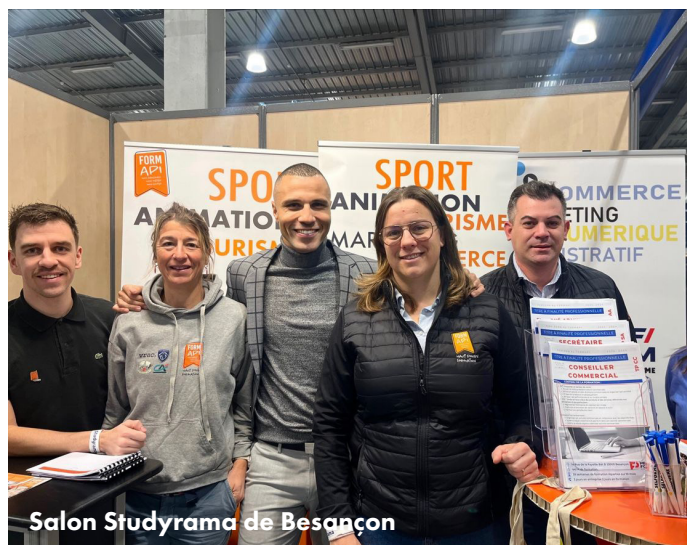
Salon Studyrama de Besançon