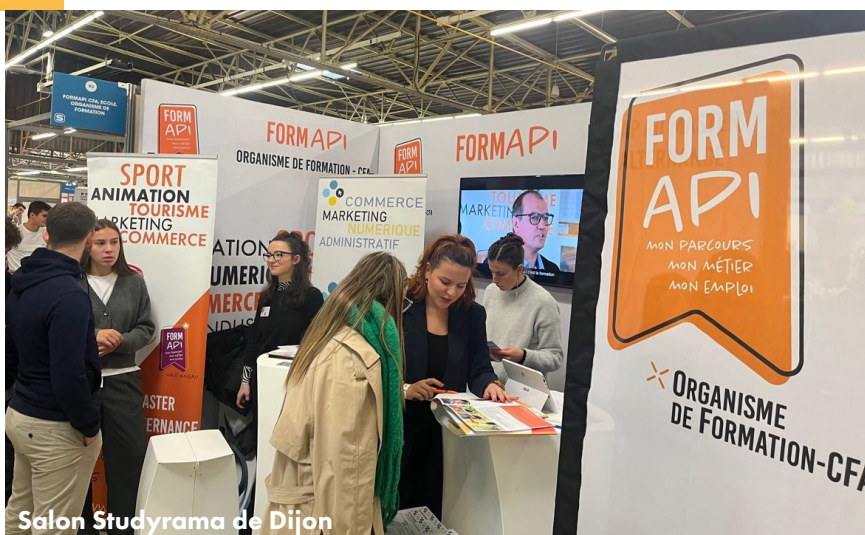
Salon Studyrama de Dijon