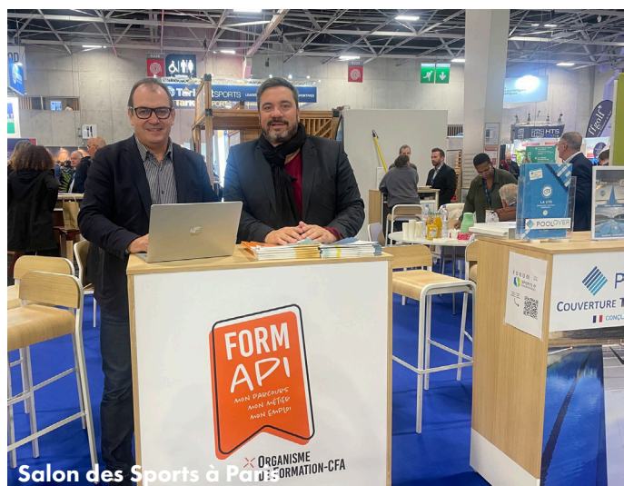
Salon des Sports à Paris