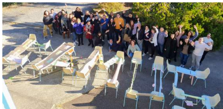
Les ateliers cohésion ont été fortement appréciés