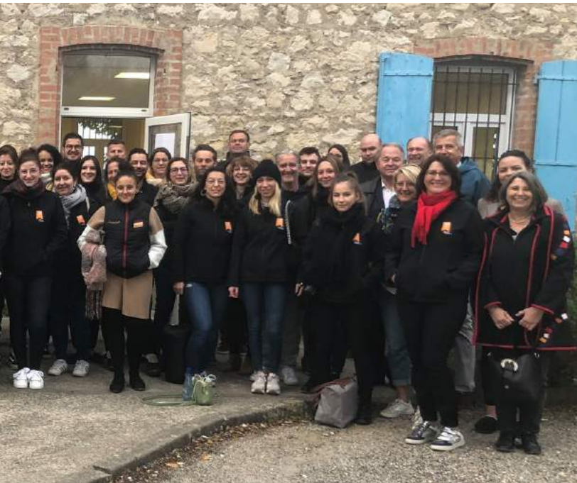
Camus réunies avec nos branches territoriales