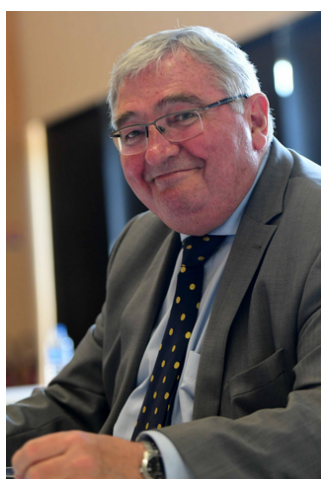
JEAN-PASCAL FICHÈRE Président de la communauté d'agglomération du Grand Dole