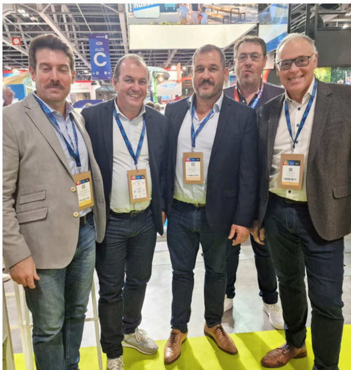
Rencontre avec les représentants de l'association «Colosse aux pieds d'argile »

Du 19 au 21 novembre, FORMAPI a participé au Salon des Sports et Parasports du 106e Congrès des maires et des présidents d'intercommunalités, dans le cadre prestigieux du parc des expositions de la Porte de Versailles à Paris.